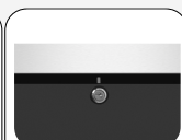
Cerradura de serie